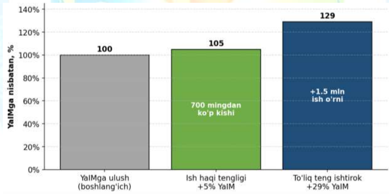
3-rasm. Gender tengligi YaIMga ta'siri: ssenariy taqqoslamasi

Jahon banki tahliliga ko'ra, ayollar iqtisodiyotda erkaklar bilan teng ishtirok etishi O'zbekiston milliy daromadini 29 foizga oshirishi mumkin (2-rasm). Bu — to'liq teng ishtirok ssenariysi. Faqat ish haqi tengligini ta'minlash ham 700 mingdan ortiq odamni kambag'allikdan chiqarishi mumkin [1; 3].